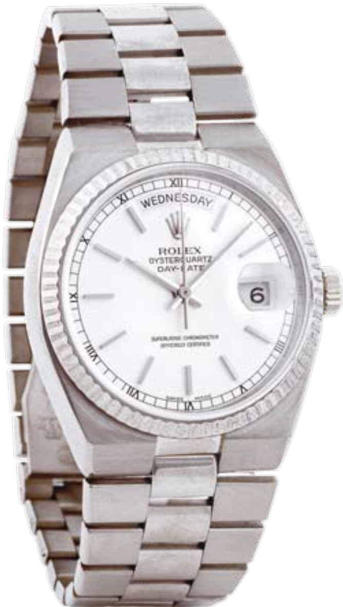
REF. 19019 ORO BIANCO 18 CT

I bracciali degli orologi Rolex Oysterquartz rispettano completamente la tradizione Rolex: sono stati studiati per integrarsi perfettamente alla cassa oyster.