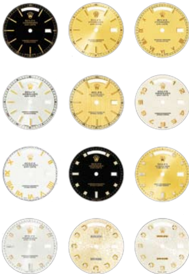
SELEZIONE DI QUADRANTI PER LE REFERENZE 19018-19028-19048-19148