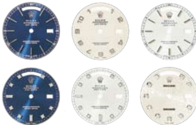
SELEZIONE DI QUADRANTI PER LE REFERENZE 19019 E 19049

Anche i modelli Day-Date Oysterquartz vantano un'ampia gamma di quadranti.