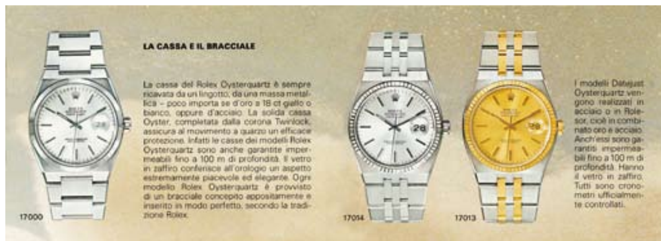
DA UN LIBRETTO D'ISTRUZIONI CHE ACCOMPAGNAVA IL ROLEX OYSTERQUARTZ DATEJUST NEGLI ANNI '90

Solo nel 1982 Rolex presenterà il Datejust Oysterquartz in acciaio con lunetta zigrinata in oro bianco 18 ct. da 36 mm. di