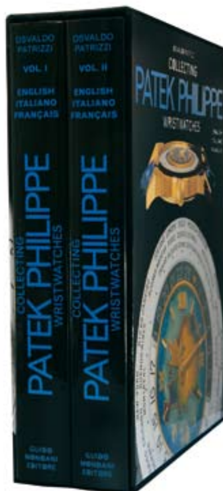
Collezione Orologi da Polso Patek Philippe