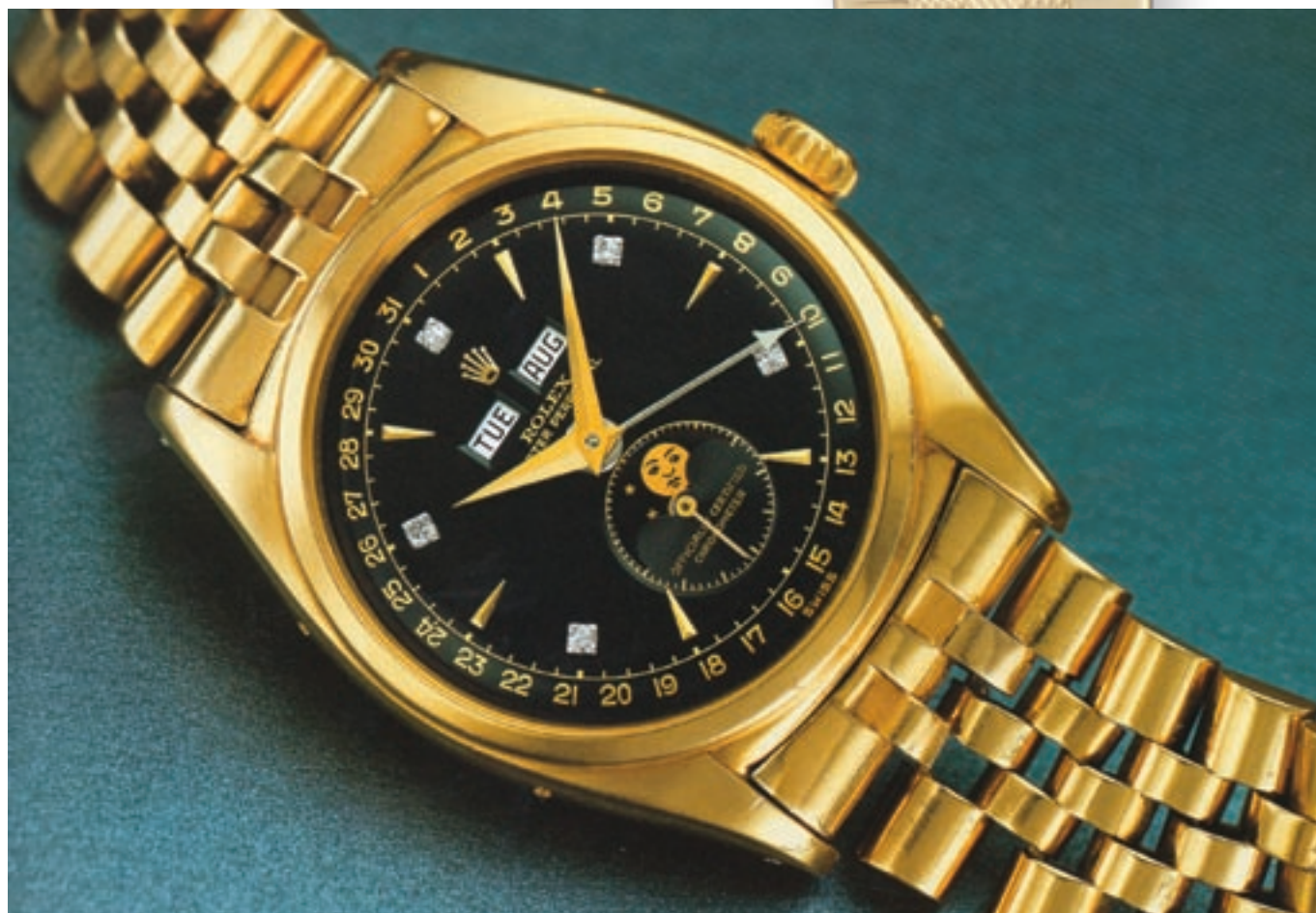
REF. 6062 QUADRANTE NERO CON 5 INDICI IN DIAMANTI