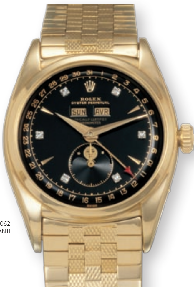
REF. 6062 QUADRANTE NERO CON 6 INDICI IN DIAMANTI

ristico è lo « Stelline », denominazione che deriva dagli indici del quadrante a forma di stella e che rappresenta una peculiarità per i modelli in oro, anche se questi ultimi presentano una vasta varietà di quadranti. Le versioni in acciaio sono caratterizzate prevalentemente dagli indici a freccia e dai numeri arabi (3-9) applicati. Il modello più raro è senza dubbio quello con quadrante nero e indici in diamanti. Fino ad oggi solo due esemplari sono apparsi nelle aste internazionali, uno con sei diamanti e uno con cinque. Quello con cinque diamanti è apparso in asta nel 2002 ed è stato venduto da Philips a Ginevra il 18/11 a 235'000 dollari (momento in cui il dollaro era notevolmente più forte, circa 160.000 euro). Quest'orologio era appartenuto all'ultimo imperatore del Vietnam, Sua Maestà Bao Dai, conosciuto per il suo buon gusto. Vantava, infatti, un'ampia collezione di macchine di lusso, palazzi, yacht, ecc. Quest'orologio fu esposto alla Fiera di Basilea nel 1953