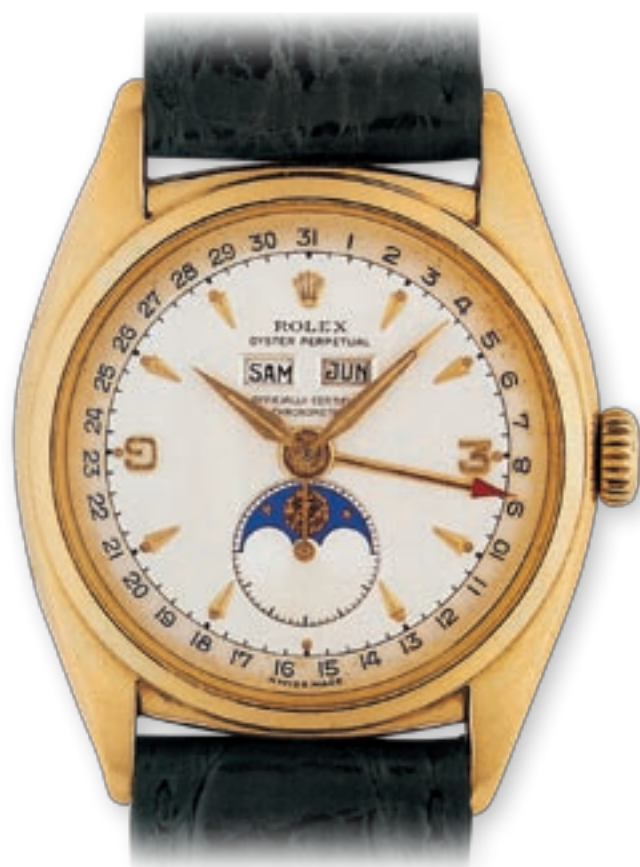
REF. 6062 VERSIONE IN ORO GIALLO 18 CT. CON INDICI APPLICATI IN ORO LA LANCETTA CHE INDICA LA DATA È A LANCIA CON LA PUNTA VERNICIATA DI ROSSO