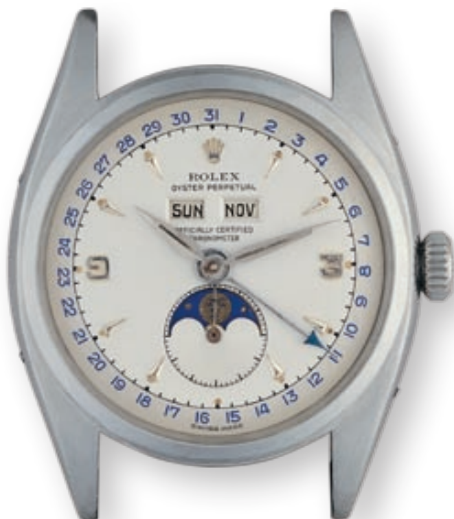
REF. 6062 VERSIONE IN ACCIAIO CON QUADRANTE DEFINITO DALLA CASA "ROLESIMUM"