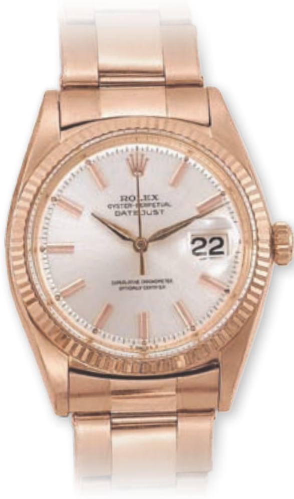
REF. 1601 OYSTER PERPETUAL DATEJUST IN ORO GIALLO 18 CT. NEL 1960 COSTAVA 470.000 LIRE (Circa 242,00 Euro)

REF. 6062 COSMOGRAPH OYSTER PERPETUAL (COSÌ ERA DEFINITO NELLE PUBBLICITÀ DELL'EPOCA) IN ORO GIALLO 18 CT. QUADRANTE "STELLINE" NEL 1960 COSTAVA 434.500 LIRE (Circa 224,00 Euro)